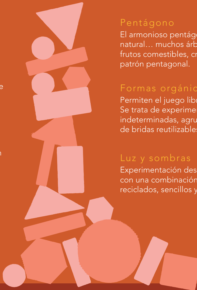
Figura estable que favorece la construcción; utilizaremos con cubos gigantes y prismas para favorecer la construcción de muros.