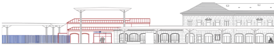
Alzado principal de conxunto, extraído do proxecto de execución. En cor vermella a terminal proposta.

Por tanto e sen entrar en valoracións arquitectónicas, a nova terminal que agora se presenta, lonxe de achegar unha solución congruente, contribúe a confundir as diferentes achegas de todas as épocas existentes no ben, afastándose dunha solución que debería de achegar valor, harmonía e coherencia ao espazo no que se sitúa.